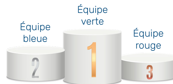
Podium par unité de travail