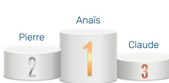
Podium par personne